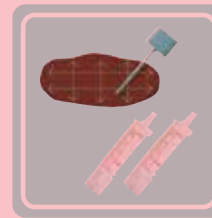
容器のフタについた棒で便の表面を採取

注) 痔の方もお受けください。現在明らかな出血や痛みがある場合は時期をずらして受けることをおすすめしますが、そのような症状がない場合は検査結果にはほぼ影響がありません。